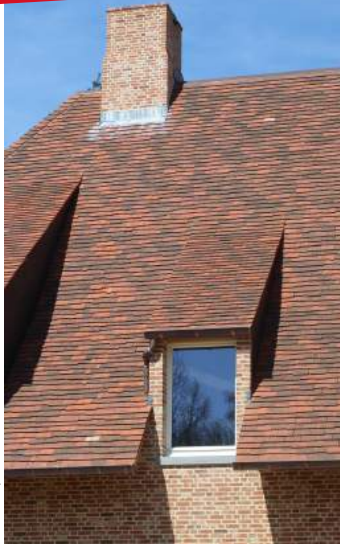
Kleur 1/3 Ebony Bruin, 1/3 Bruin Zwart, 1/3 Bruin Violet