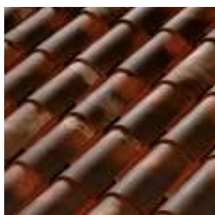
Manoir (op bestelling leverbaar)