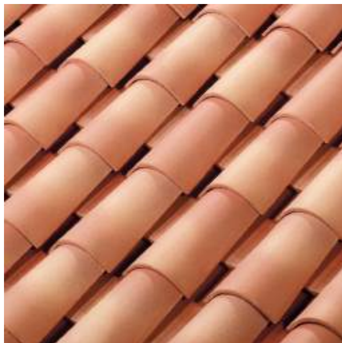
Flammé Languedoc in de massa