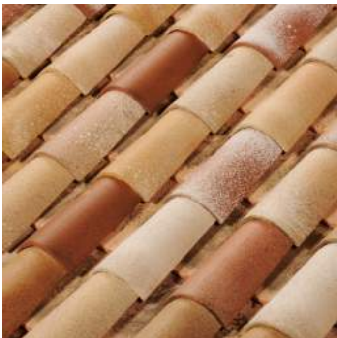
Terre du sud