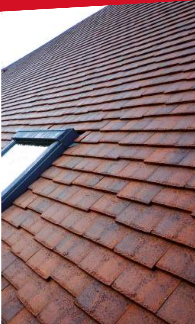
Kleur Bezand Bourgogne